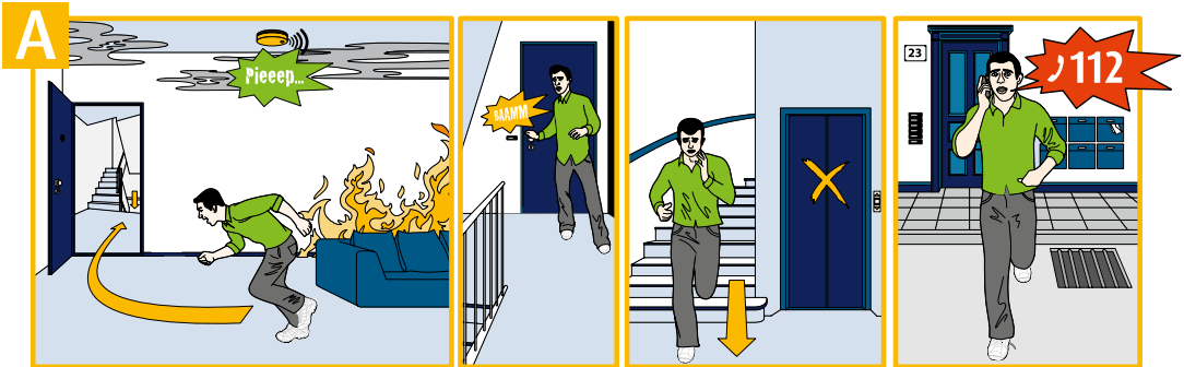
Ins Treppenhaus flüchten

Im Brandfall zählt jede Sekunde. Gut, wenn Ihr Rauchwarnmelder Sie frühzeitig auf die Gefahrensituation aufmerksam macht und Sie die Möglichkeit haben, Ihre Wohnung rechtzeitig zu verlassen.